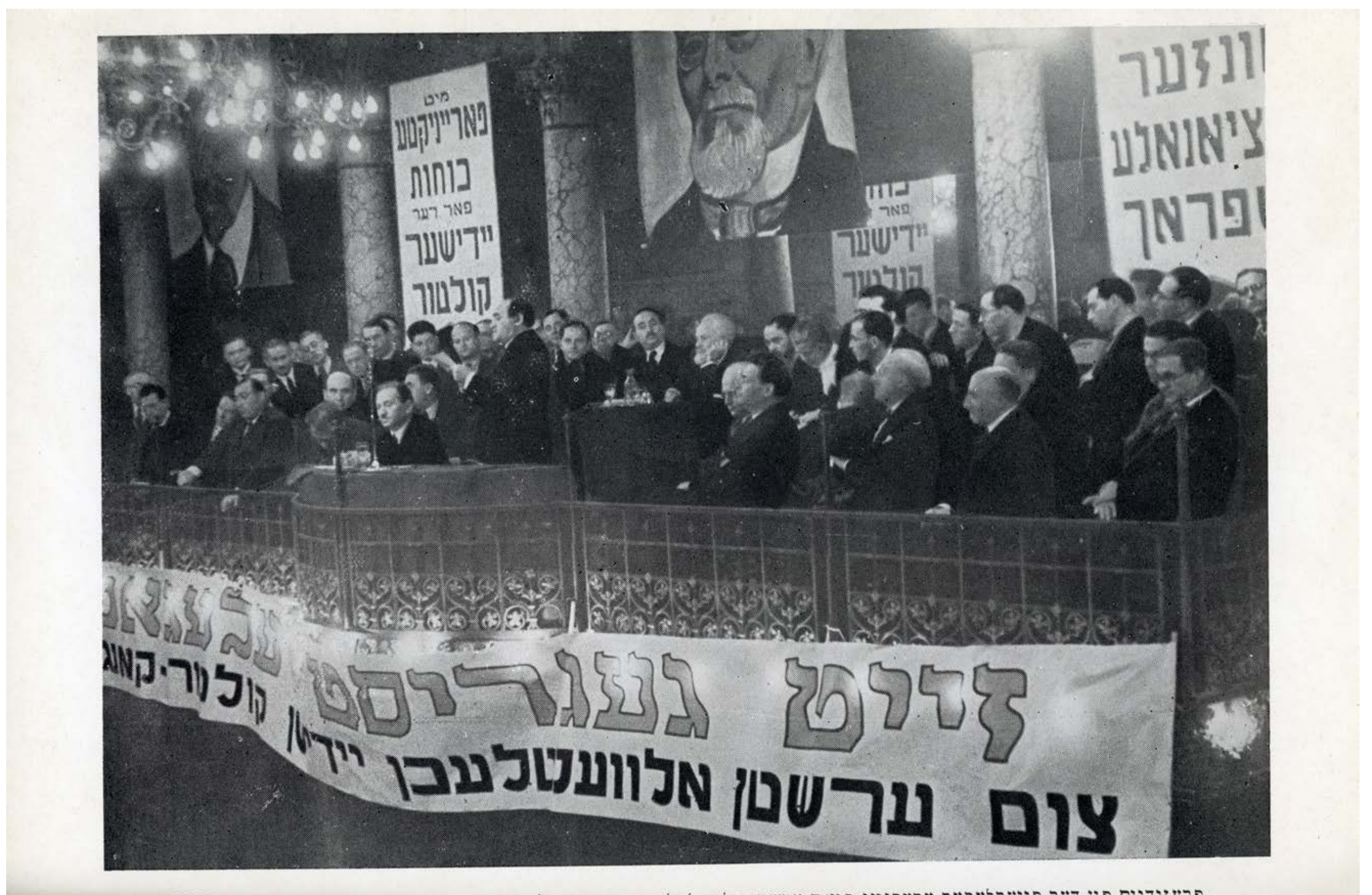
פרעזידיום פֿון דער פייערלעכער ערעפֿנונג פֿונעם ערשטן אַלוועלטלעכן יידישן קולטור־קאָנגרעס דעם 17טן פעפּטעמבער 1937